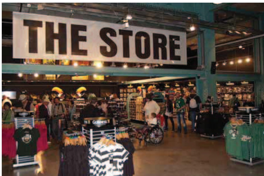
Shoppen i Guinness Storehouse er det eneste sted med detailsalg for Guinness. Over 60 procent af de produkter som er til salg her, er eksklusivt fremstillet til salg i denne forretning. Men der er andre souvenirforretninger i Dublin og Irland, som har licens til at sælge nogle af Guinnessprodukterne.

Guinness Storehouse: For folk, som ikke lige kommer til Dublin og Irland, men kunne tænke sig Guinness merchandise, kan dette ske ved køb over: www.guinnesswebstore.com .