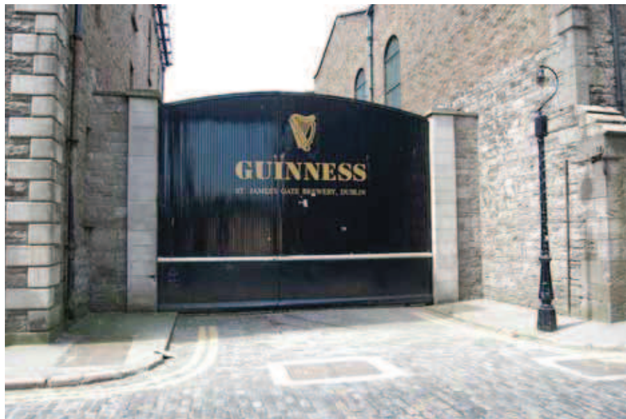
Guinness Storehouse ligger tæt op af St.James's Gate, hvor det hele begyndte for 252 år siden.

”Dublin, The Home of Guinness. Born in Ireland – adored worldwide”, står der ved indgangen til det syv etagers høje Guinness Storehouse, som er stedet, hvor turister med interesse for Guinness i alle dets facetter kan få syn for sagn. Den lig-